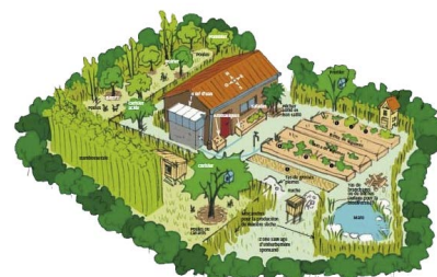
Exemple de plans. A vos crayons.